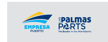
Marca conjunta a color