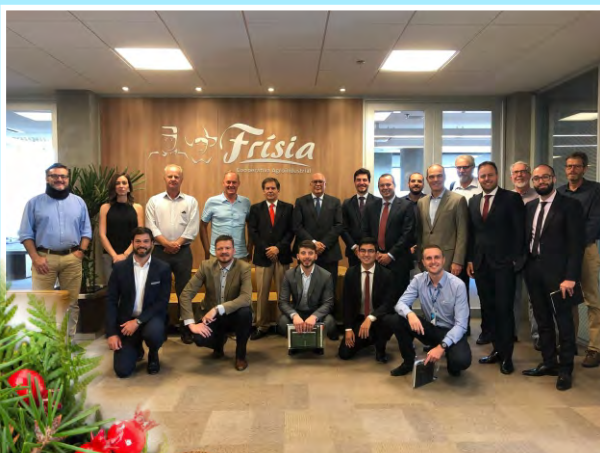
La Fundación y Fedeport, en Brasil