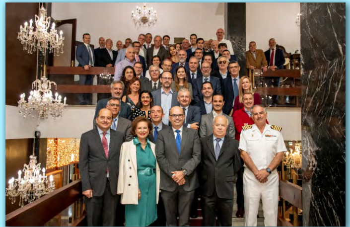
Almuerzo de Navidad de Asocelpa