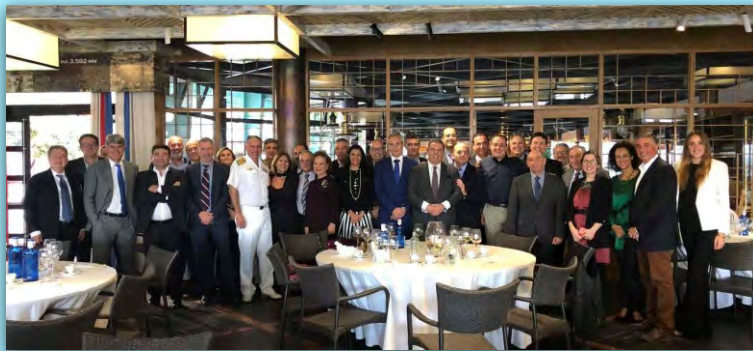
Almuerzo Navideño FEDEPORT. Noviembre de 2018