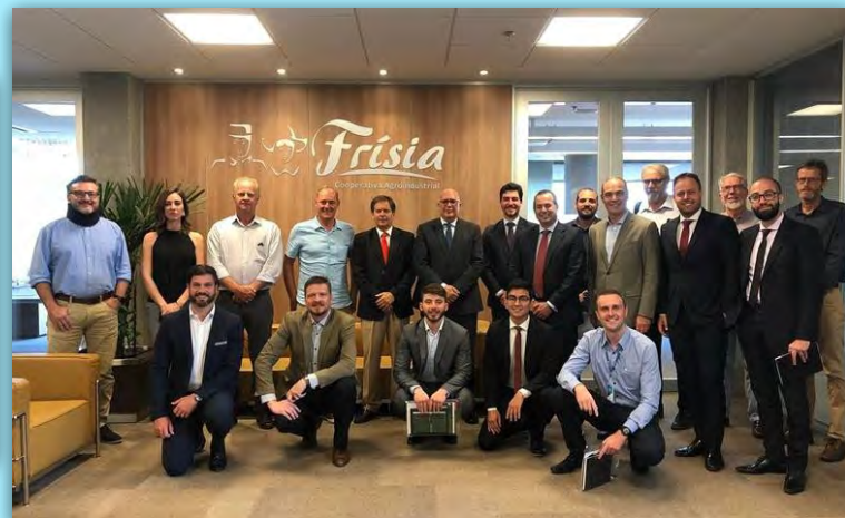
Importante reunión de la Fundación Puertos de Las Palmas y Fedeport con las tres cooperativas más importante del estado de Paraná en Brasil. Diciembre 2018