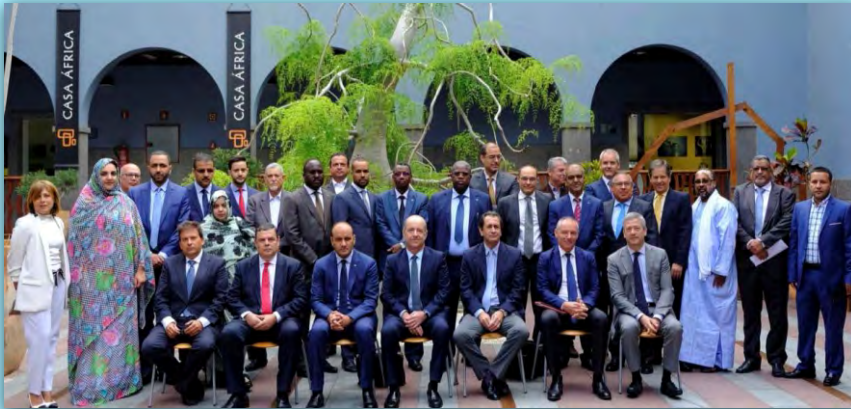
Foro sectorial de intercambio empresarial para el fomento de iniciativas mixtas entre Canarias y Mauritania en los sectores vinculados al tratamiento de la pesca, la industria extractiva y el sector turístico' en Casa África. FEDEPORT. Mayo 2018