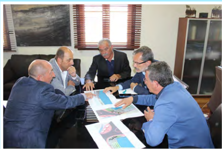
Visita a la isla de Fuerteventura