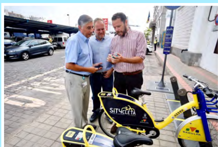
La Sitycleta en el recinto portuario