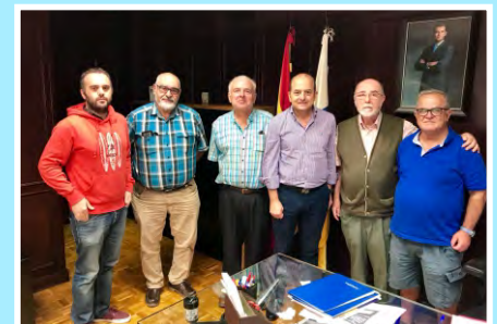
Comité del Bienestar para los tripulantes