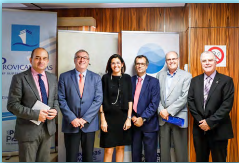
Jomada sobre las novedades del REF