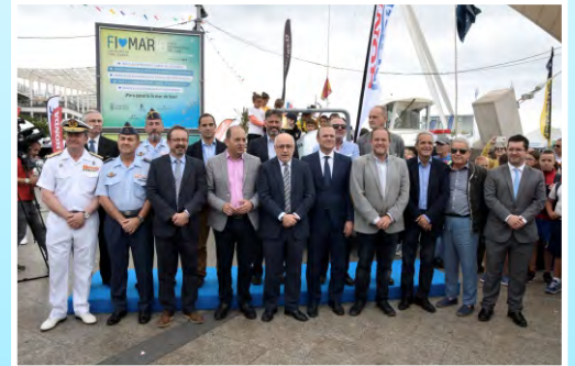
Puertos de Las Palmas, en Fimar 2018