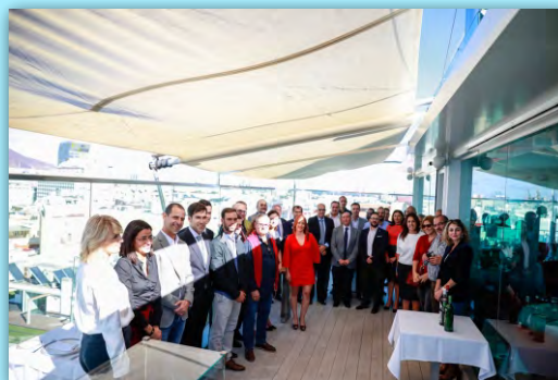
Almuerzo navideño de Oneport Canarias