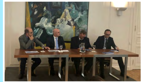
Puertos de Las Palmas visita Argentina