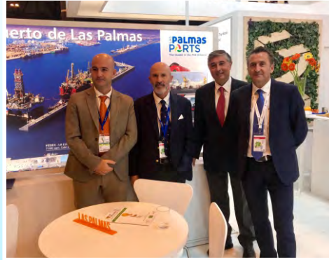
En la Fruit Attraction de Madrid