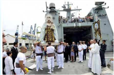
Fiestas en Honor a la Virgen del Carmen