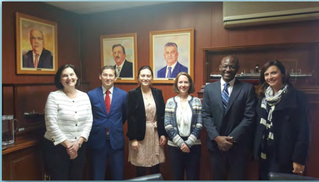
Encuentro con representantes del Consulado de Estados Unidos de América en Las Palmas y de su Embajada en Madrid