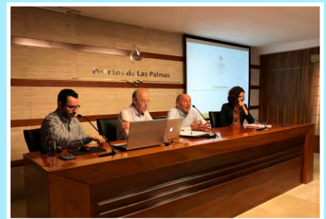
Nueva Sede Electrónica para la comunidad portuaria