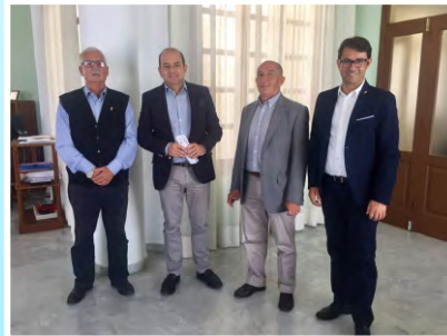
Cardona y Capella visitan Lanzarote