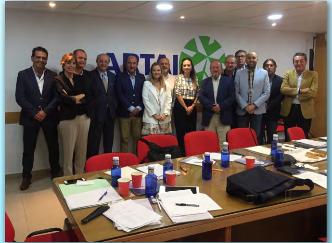
Reunión ASECOB, de Asociaciones Provinciales de Consignatarios