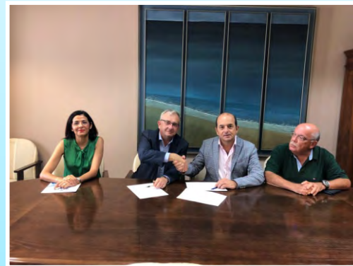
La Autoridad Portuaria y OPCSA sellan un acuerdo para la reordenación de la Terminal de Contenedores que mejorará la capacidad del Puerto grancañario como Hub logístico