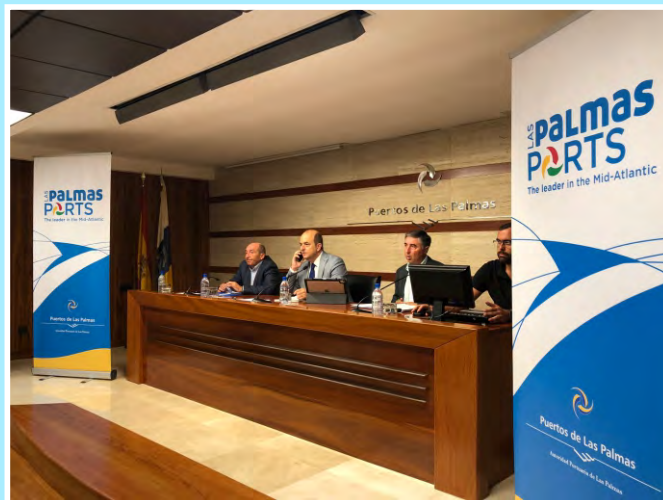
Presentación de la nueva marca comercial Las Palmas Ports the Leader in the Mid-Atlantic