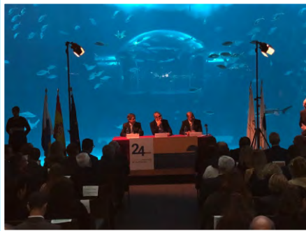
Premios Fundación Puertos de Las Palmas 2017