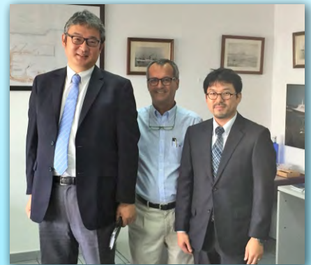
Encuentro con Takeshi Nakajima, cónsul de Japón