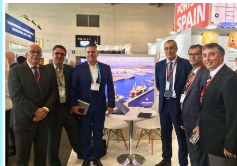
Empresarios portuarios en la BreakBulk 2018