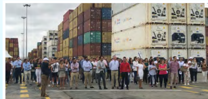
Jornada de puertas abiertas en OPCSA