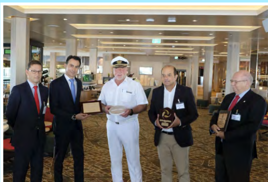
Bienvenida al MV Mein Schiff 1