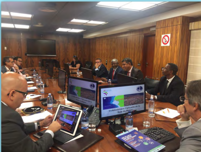
Encuentro con representantes de puertos mauritanos