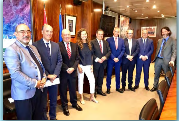
Fedeport plantea a la Presidenta de Puertos del Estado en Madrid la necesidad de definir un modelo estratégico de futuro para los puertos de Las Palmas. AGOSTO 18