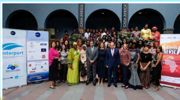
Jornadas de la Mujer Portuaria Africana y Española