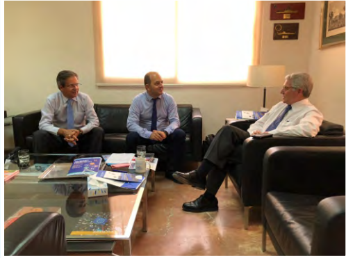
Visita a Mauritania