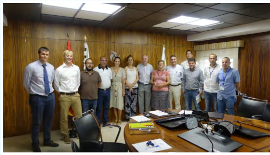
Coordinación para la ARC 2018