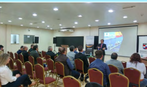
La Fundación Puertos de Las Palmas, en Paraguay