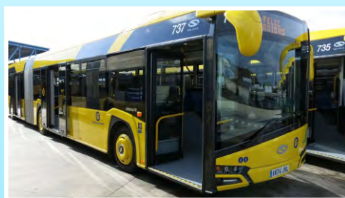
Línea 18 de Guaguas Municipales