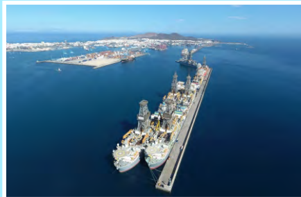
Vía libre del Estado para ampliar el Reina Sofia