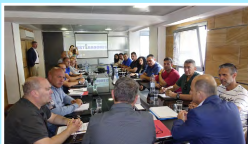
Reunión con los estibadores