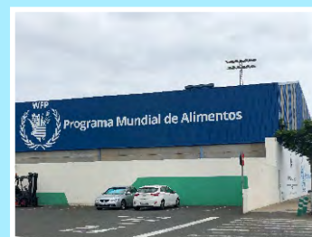
Colaboración con el Programa Mundial de Alimentos