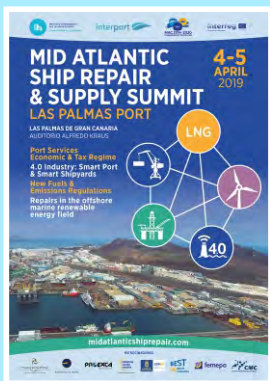
Cumbre de Reparaciones Navales y Suministro a Buques