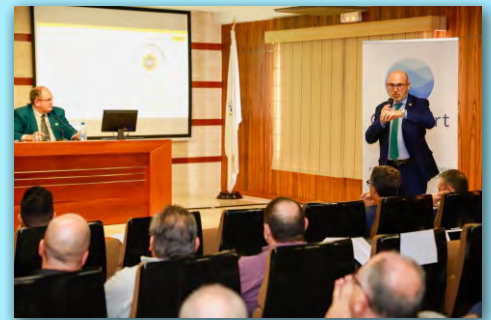
Jomada sobre modelos de seguridad en recintos portuarios