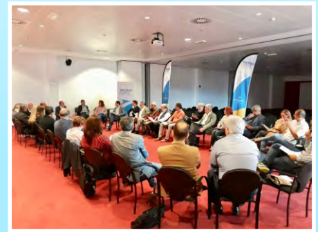
Reunión de la Mesa +PORT