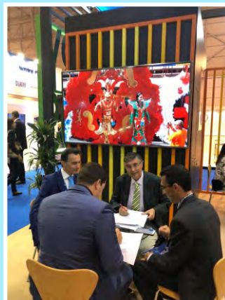
En la Seatrade Cruise Med de Lisboa